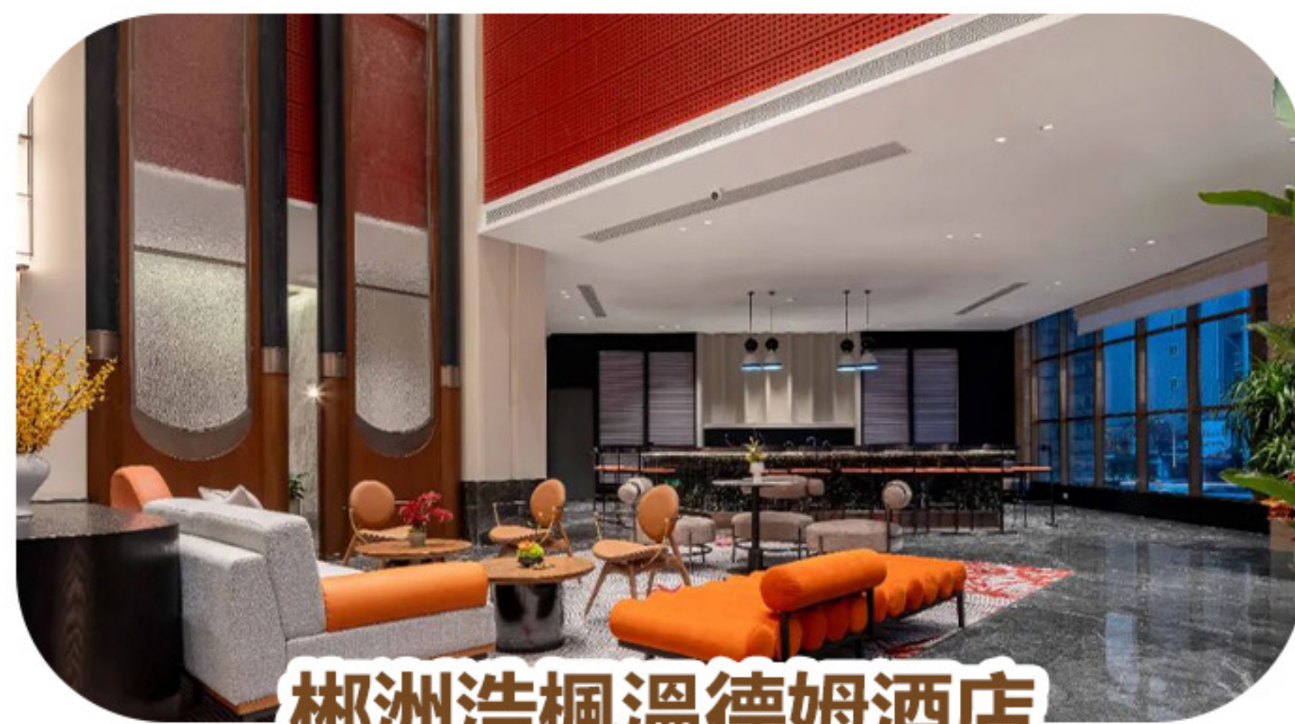
郴州浩楓溫德姆酒店