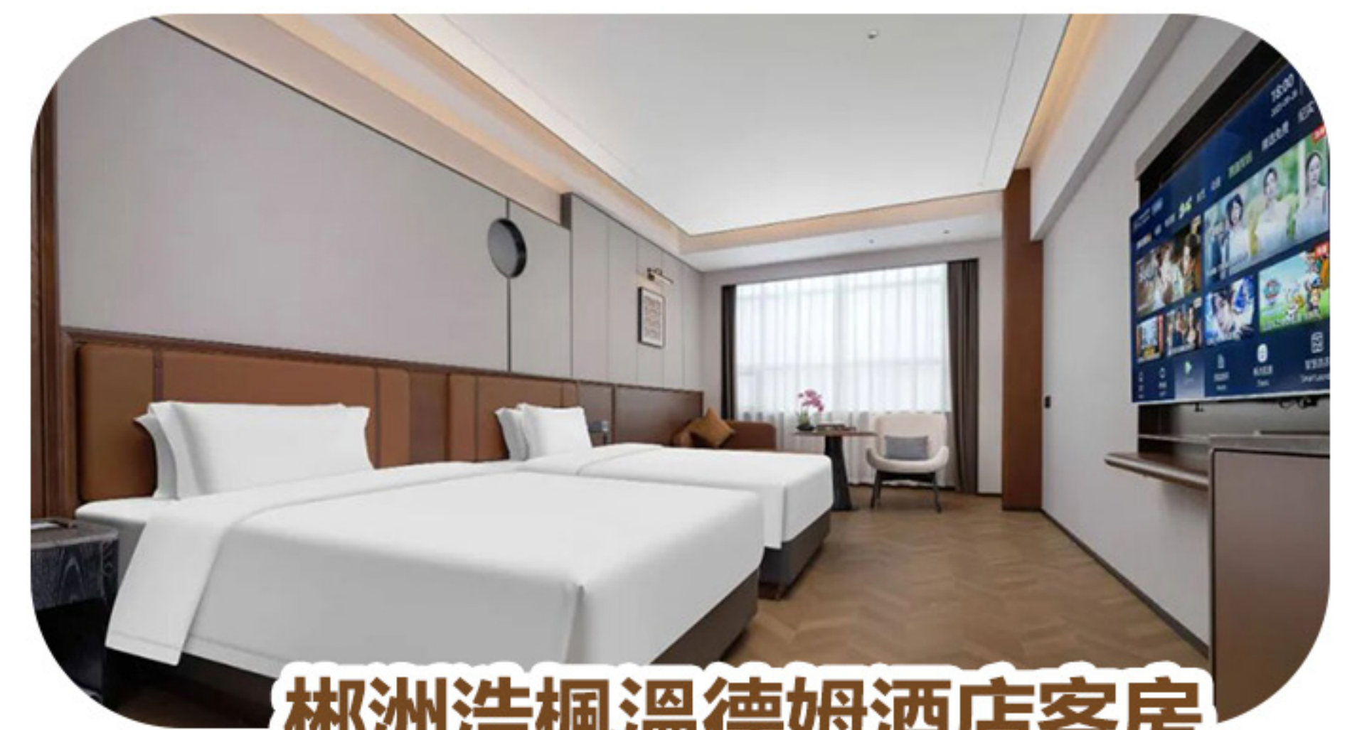
郴州浩楓溫德姆酒店客房