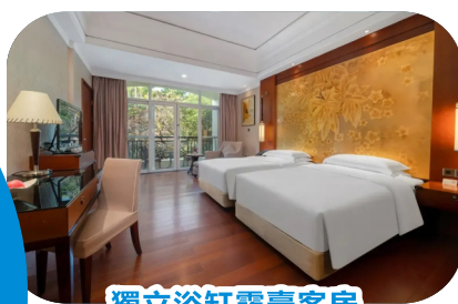
獨立浴缸露臺客房