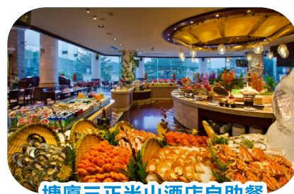
塘廈三正半山酒店自助餐