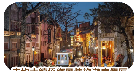
赤坎古鎮僑鄉風情旅遊度假區