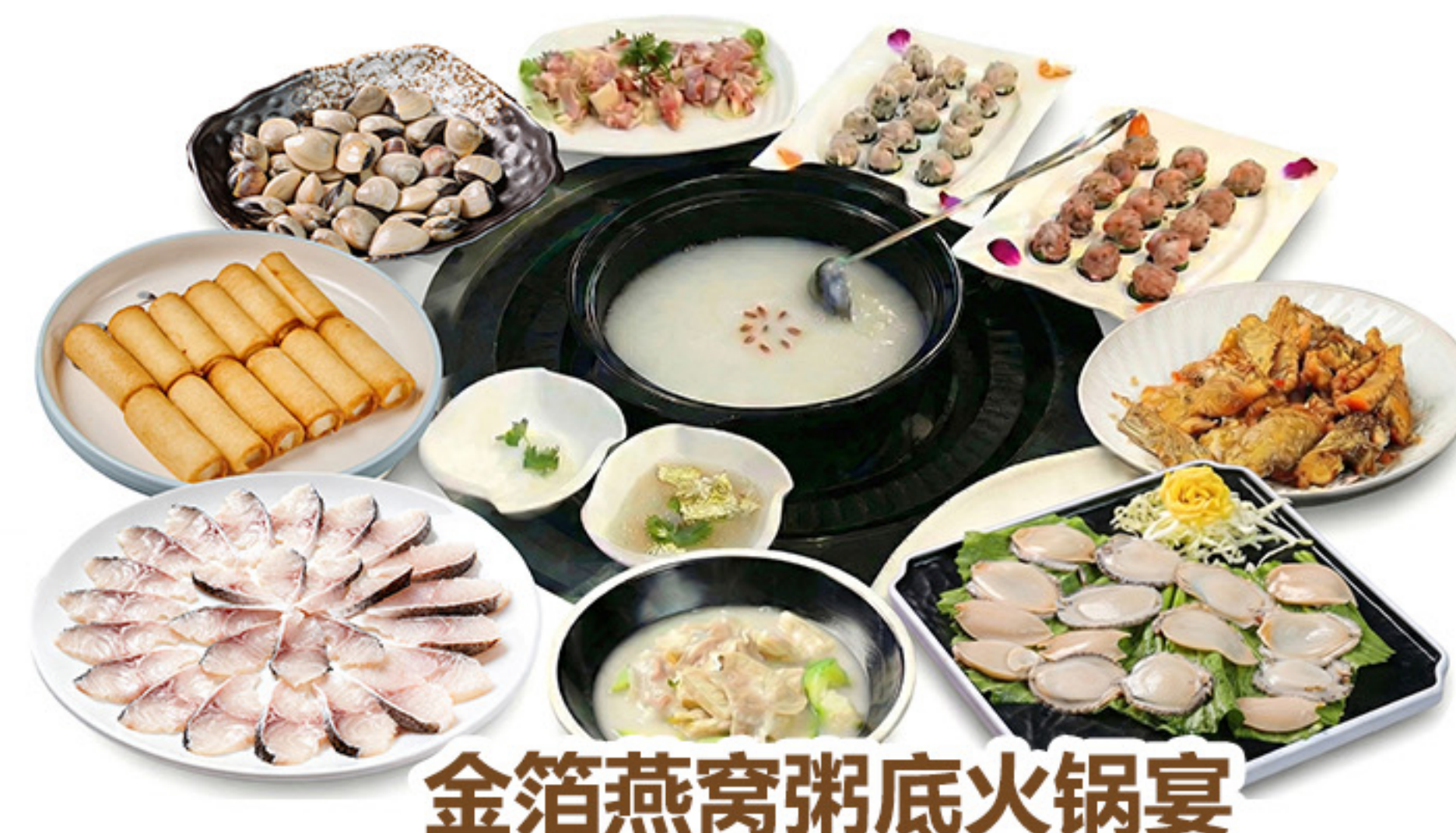
金箔燕窩粥底火鍋宴