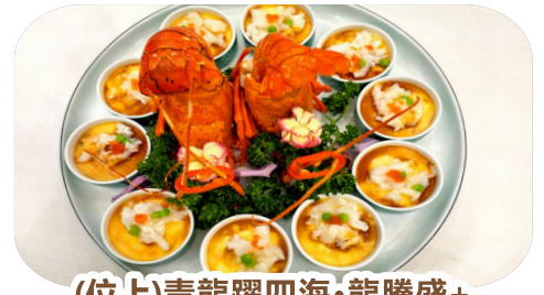
(位上)青龍躍四海·龍騰盛+ (位上)金湯珍饈火腿燴花膠宴