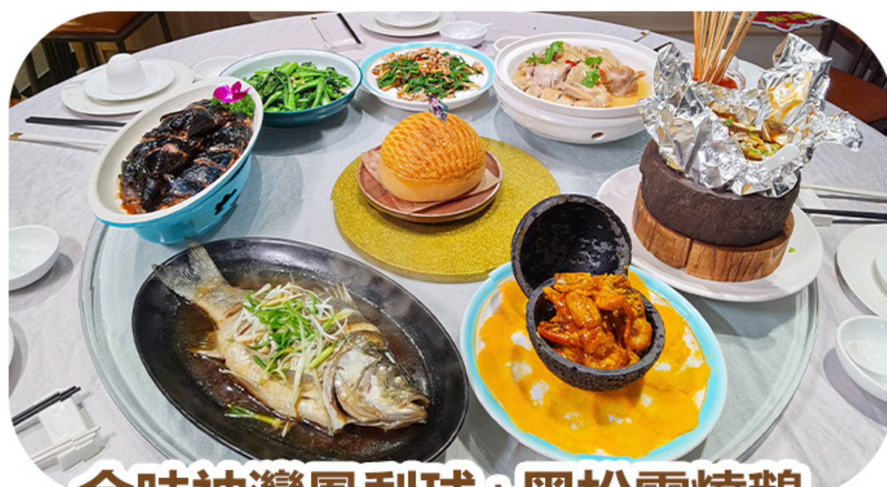
金味神灣鳳梨球+黑松露燒鵝