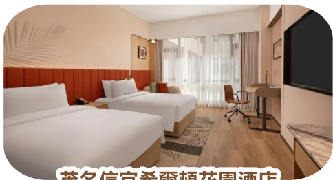
茂名信宜希爾頓花園酒店