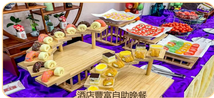
酒店豐富自助晚餐