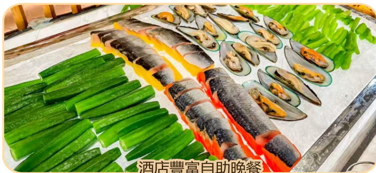
酒店豐富自助晚餐