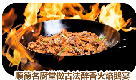
順德名廚堂做古法醉香火焰鵝宴