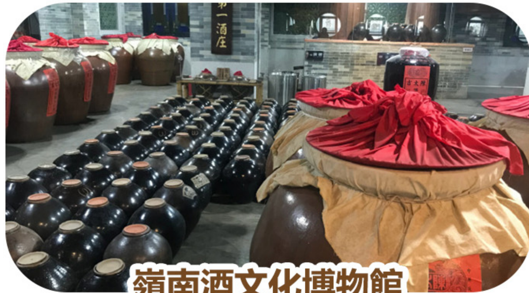
嶺南酒文化博物館