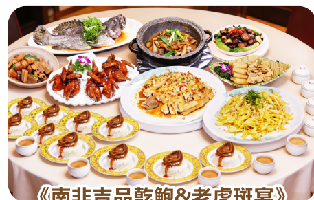
《南非吉品乾鮑&老虎斑宴》 【(位上)十五頭南非乾鮑撈飯+(位上)鮮人參頓海味肉汁湯羹】