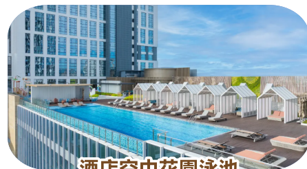
酒店空中花園泳池