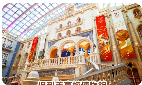
保利美高梅博物館