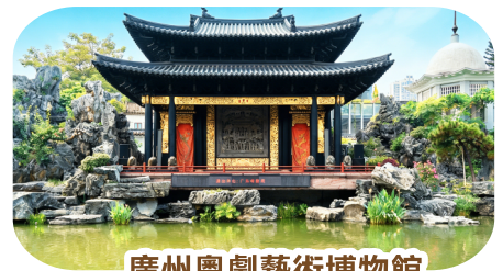
廣州粵劇藝術博物館