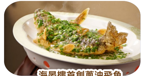
海晏樓首創蔥油飛魚