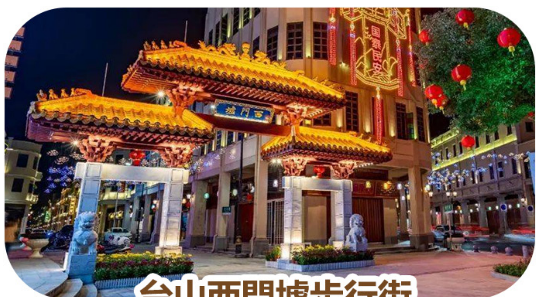
台山西門墟步行街