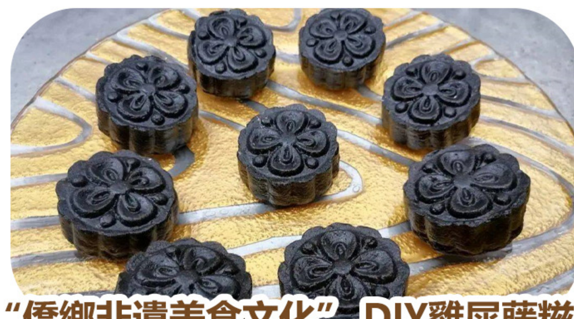
“僑鄉非遺美食文化”DIY雞屎藤糍