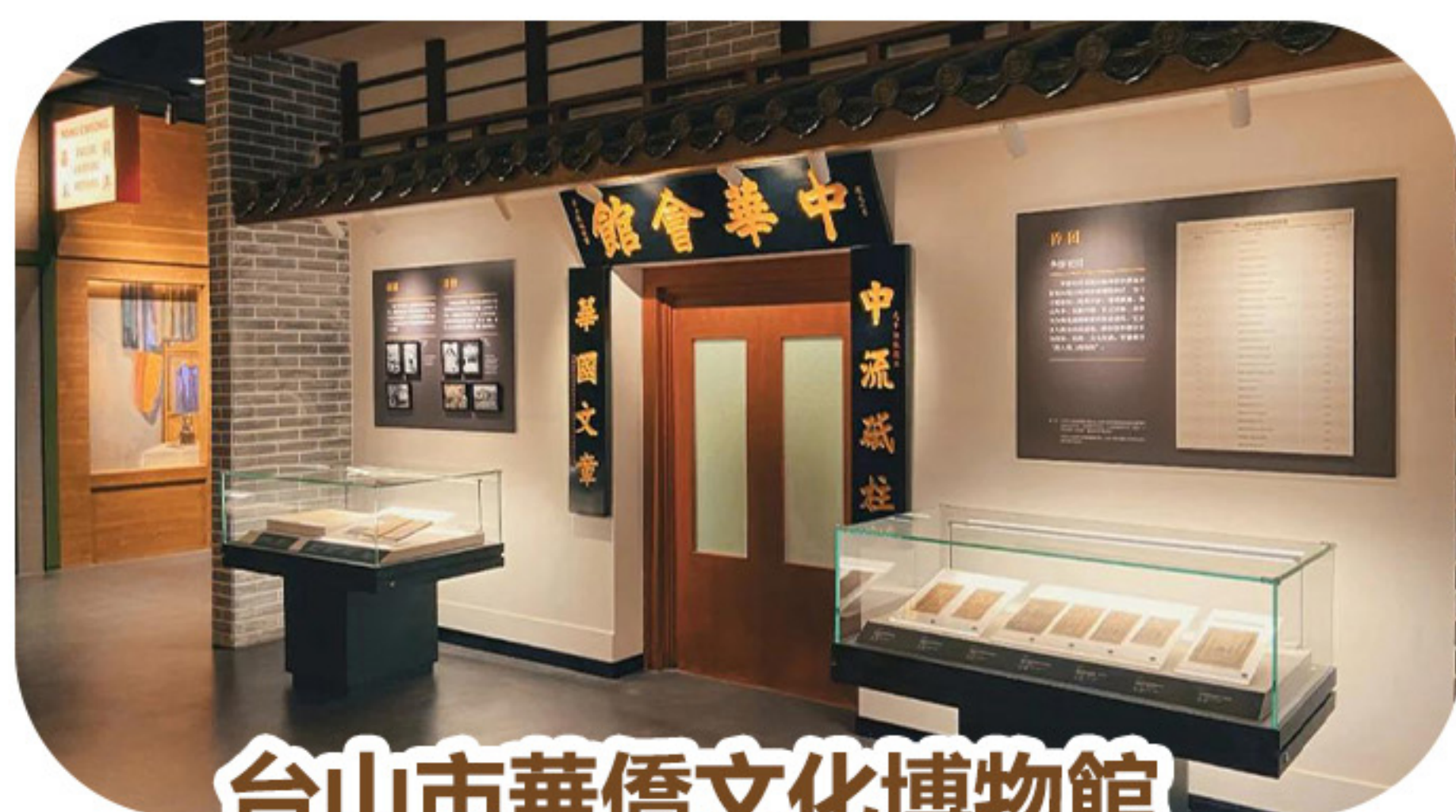
台山市華僑文化博物館