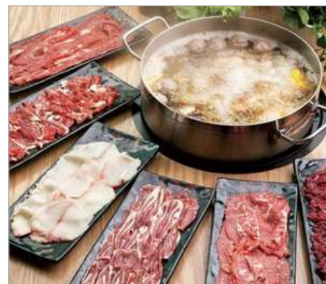
任食一人一鍋金牌牛肉火鍋