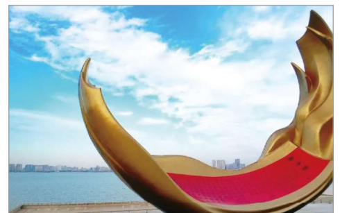
潮汕歷史博覽中心