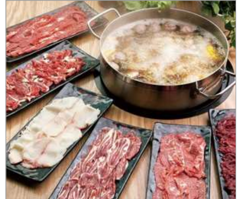
任食一人一鍋金牌牛肉火鍋