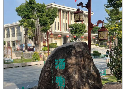
達濠古城(2026年8月1日起出發之團隊適用)