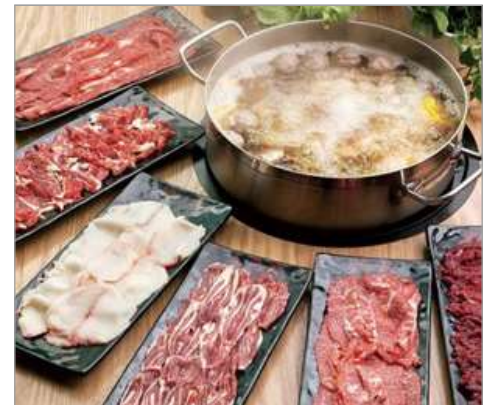
任食一人一鍋金牌牛肉火鍋