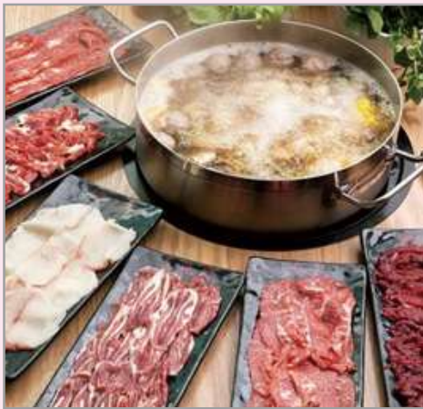
任食一人一鍋金牌牛肉火鍋