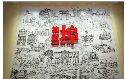
汕頭開埠文化陳列館