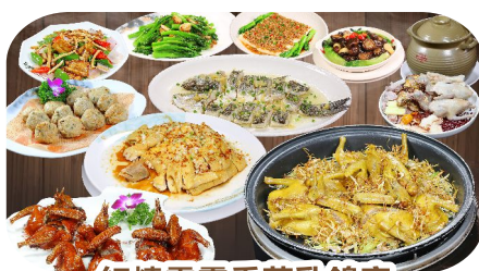
紅燒霹靂香茅乳鴿宴