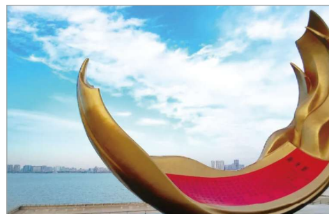
潮汕歷史博覽中心