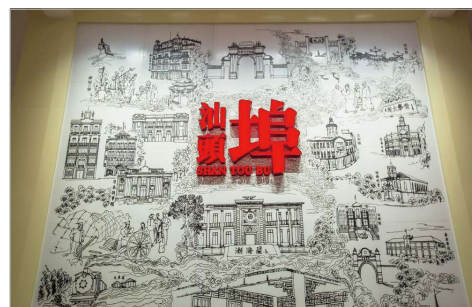
汕頭開埠文化陳列館