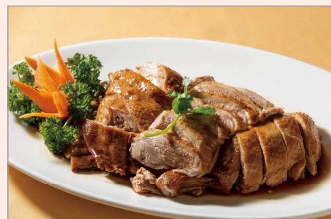
祖傳鹵水獅頭鵝全鵝宴